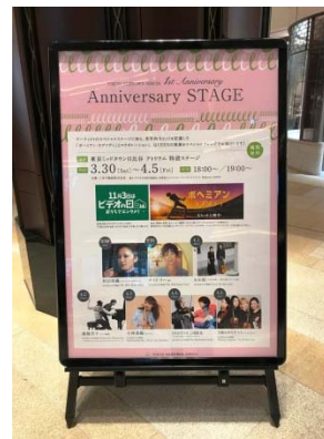
プログラム告知ボード