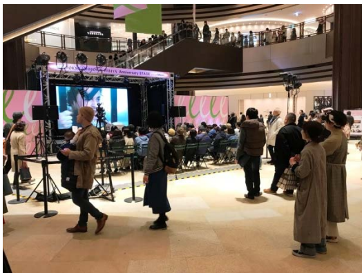
多くの人が PV 集に注目

本年度の PR 企画は、2019 年 3 月 30 日（土）から 4 月 5 日（金）まで東京ミッドタウン日比谷のオープン 1 周年を記念した、「ビデオの日」とのコラボイベントの実施をキックオフイベントとしてスタートしました。ステージでは昨年「映像 百花繚乱」野外上映会でも好評だった「平成の 30 年を彩ったビデオ作品・PV 集」を今回の上映用に再編集したものを毎日上映しました。行き交う人々の足を止め、既設の座席でじっくり観入る方々も多く、「ビデオの日」をアピールしました。夕方には映画『ボヘミアン・ラプソディ』の映像と共に、様々なミュージシャンがクイーンの曲などを披露するステージが展開されました。