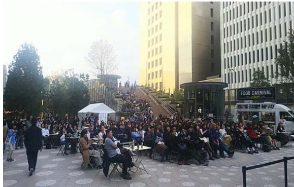
*昨年「スパイダーマン ホームカミング」上映時の観客

昨年大好評だった「東京国際映画祭」×「11月3日はビデオの日」コラボイベント『映像 百花繚乱上映会 2019（仮）』を今年も継続開催予定です。場所も同じ東京ミッドタウン 日比谷を予定しております。現在「東京国際映画祭」と協議中のため詳細は決定後お知らせいたしますが、本年度は CDVJ（日本コンパクトディスクレンタル商業組合）とも連携して実施する予定です。その連携により規模を拡大し、ビデオの楽しさが実感できる上映会を検討しております。