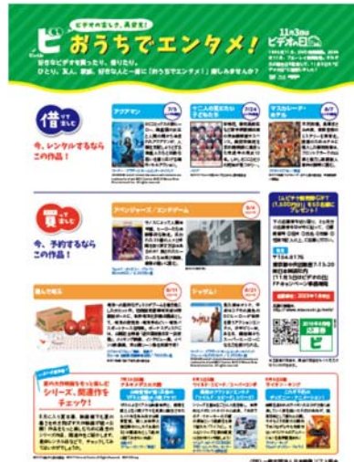
最新 8 月掲載号